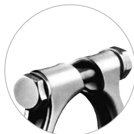
Version M10 et M12 avec vis hexagonale.