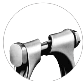
Version M8 avec vis carrée.

** Sous la tête de la vis (choisir les diamètres nominaux uniquement).