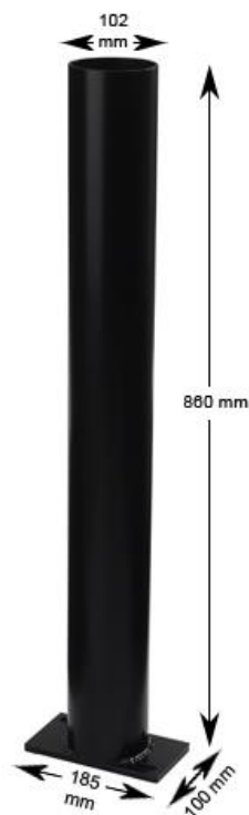
Figur 1 Art.no: 1090178